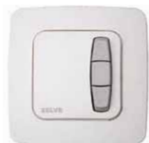
Unterputz Schalter Selve I Switch