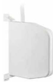
Aufputz Gurtwickler mit Gurt 14 mm