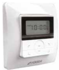
Funkwandsender Yooda Aura mit Funkprogrammschaltuhr