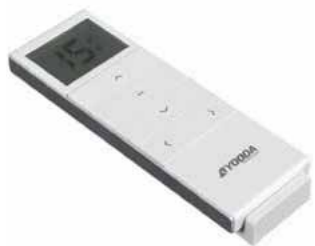
15-Kanal Handsender Magnetic