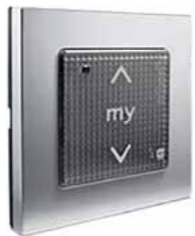
Funkwandsender Somfy Smooove Origin io Shine