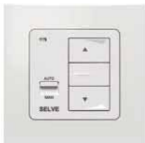
Funkwandsender Yooda Aura