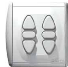
Unterputz 2 fach Schalter Somfy Inis Duo