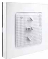
Funkwandsender Somfy Smooove Origin RTS