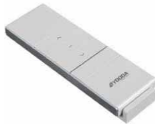
1-Kanal Handsender Magnetic