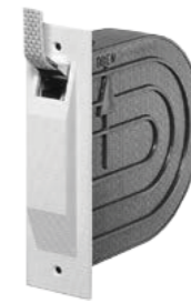
Unterputz Gurtwickler mit Gurt 14 mm