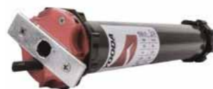
Yooda 45S kurz Länge des Motors 345 mm