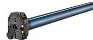
Somfy LT 50 JET NHK RTS