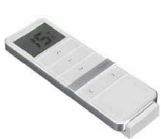
15-Kanal Handsender Magnetic Deluxe