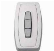
Aufputz Schalter Selve I Switch