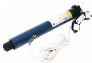
v – kurz Länge des Motors 375 mm