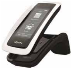
Somfy Nina io