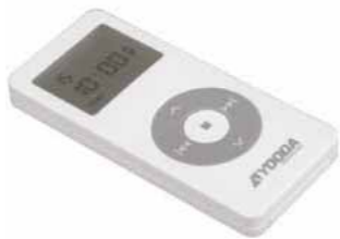
Yooda Melody mit Zeitschalter