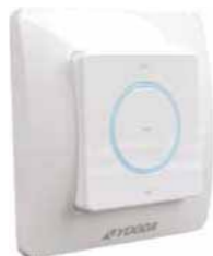
Funkwandsender Yooda Aura